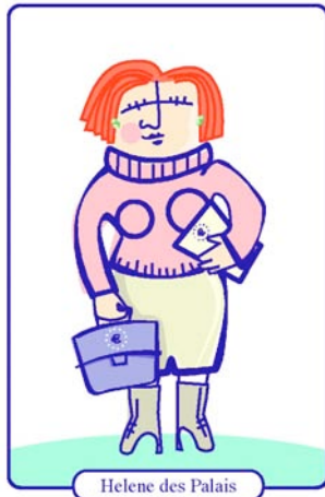
Helene des Palais